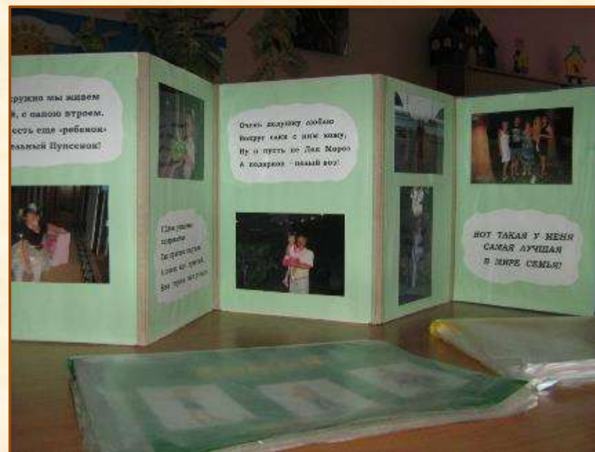
Совместное оформление ширм, газет, фотоальбомов «Наша дружная семья»