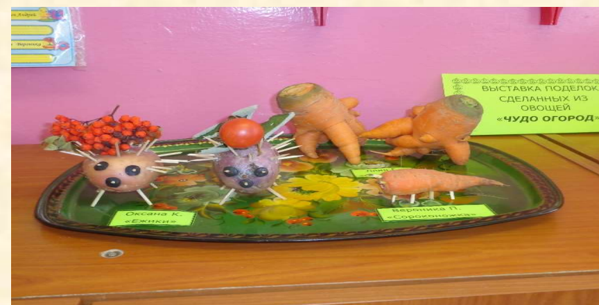
•Сотворчество детей и родителей