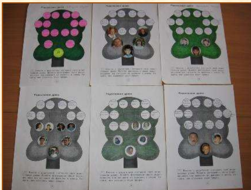
Составление генеалогического дерева