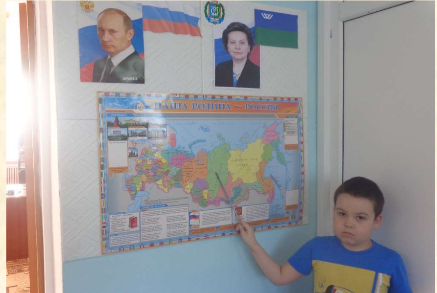
Уголок патриотического воспитания